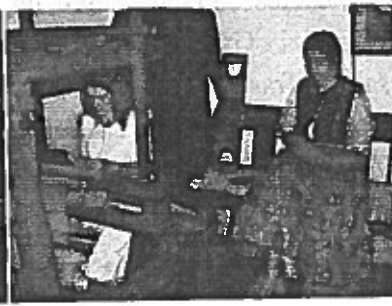
Éltre kelt a szövőszék (Szlovák Tájház)