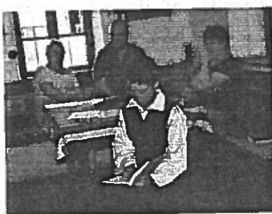
Mesehallgatás a Múzeumok éjszakáján a Szlovák Tájházban