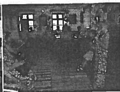
Visszaemlékezés az eltelt 45 évre (Szlovák Tájház)