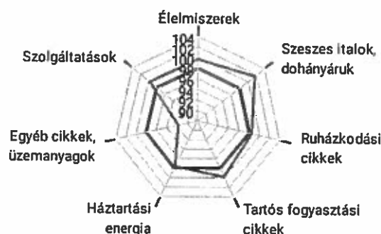
Fogyasztóiár-index főcsoportonként, 2015. október (az előző év azonos időszaka = 100,0%)